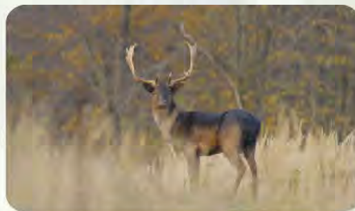
DANĚK SKVRNITÝ (EVROPSKÝ)