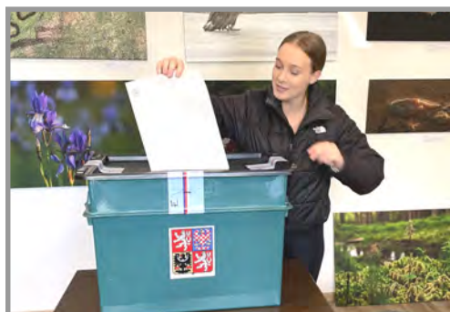
Prvovoličky u voleb